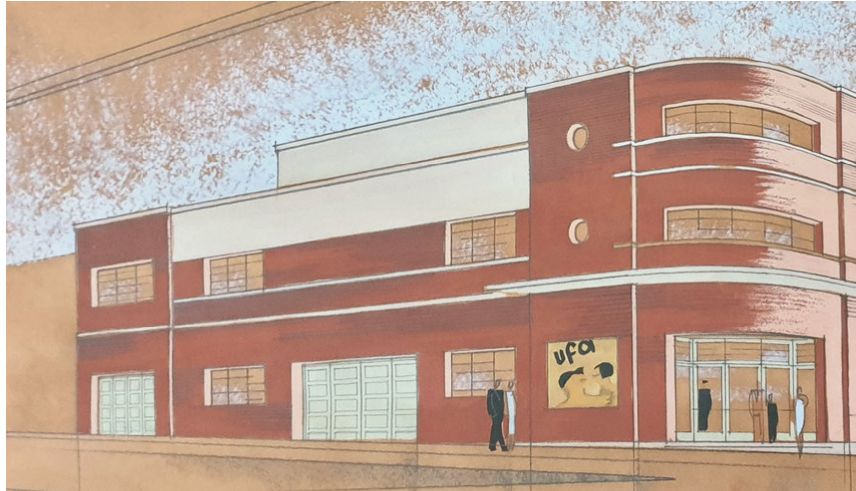
Fachada lateral del teatro-cine de Guía (Gran Canaria) hacia la calle Poeta Manuel González Sosa. Fernando de la Escosura (ES 35001 AMC/DS 0005, detalle).