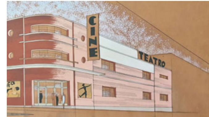
Fachada lateral del teatro-cine de Guía (Gran Canaria) hacia la calle Marqués del Muni. Fernando de la Escosura (ES 35001 AMC/DS 005, detalle).

extiende entre la curva y el chaflán sigue describiendo esa línea continua marcada por los vanos y las molduras que refuerzan las líneas horizontales, acentuando el sentido unitario que presenta la estructura general del paramento.