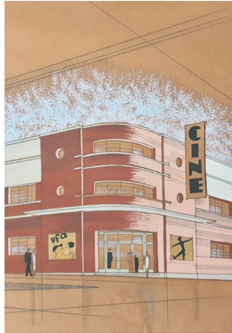
Fachada del teatro-cine de Guía (Gran Canaria). Solución de la esquina en curva. Fernando de la Escosura (ES 35001 AMC/DS 0005, detalle).