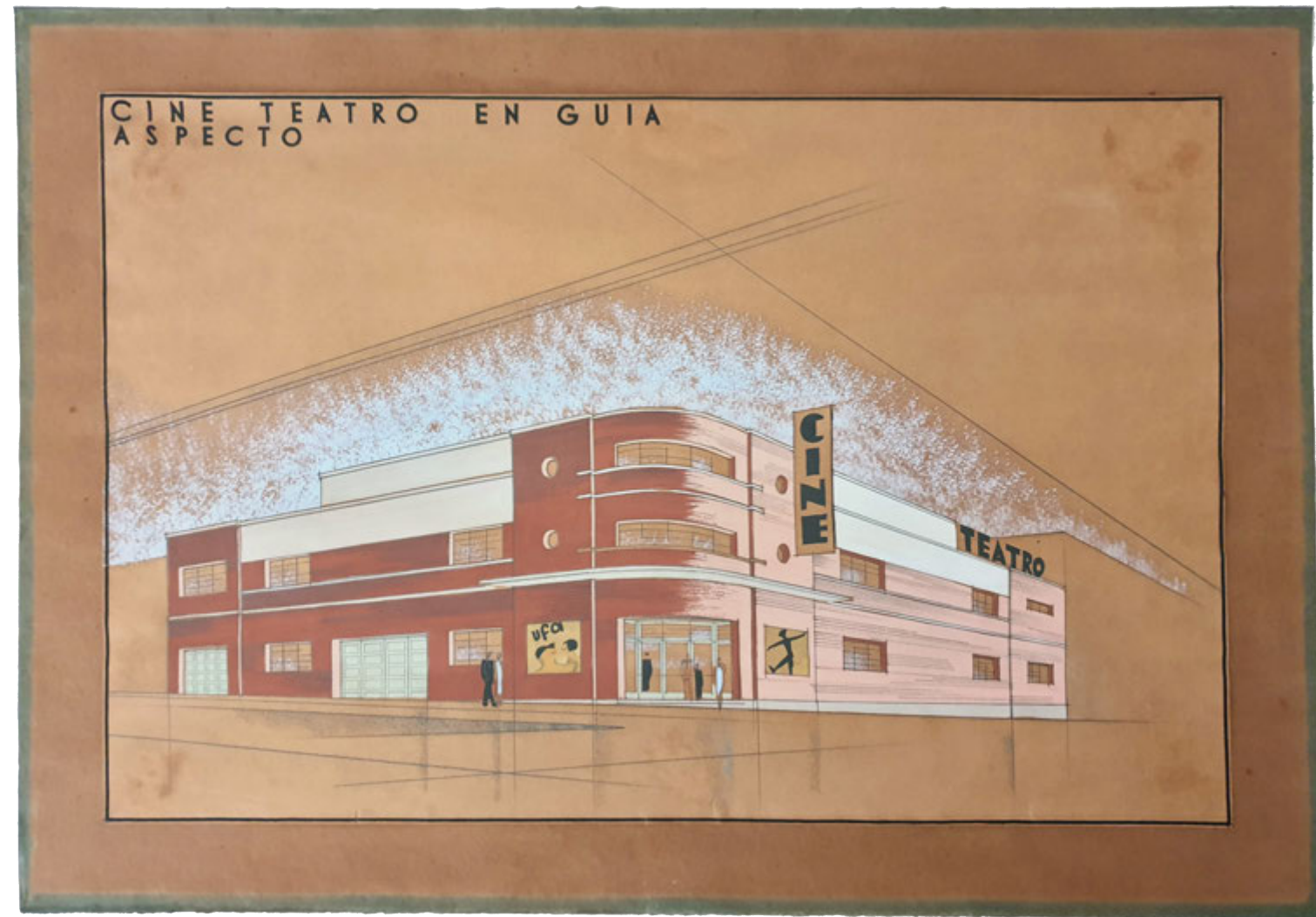
Teatro-cine (Guía, Gran Canaria). Perspectiva de la fachada. (ES 35001 AMC/DS 0005).