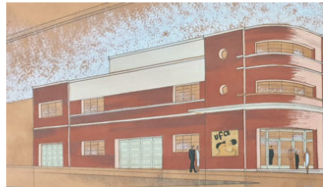
Fachada lateral del teatro-cine de Guía (Gran Canaria) hacia la calle Poeta Manuel González Sosa. Fernando de la Escosura (ES 35001 AMC/DS 0005, detalle).

Además del citado acceso dispuesto en curva, el local de espectáculos contaba con otro punto de entrada dispuesto en la fachada lateral situada hacia la actual calle Poeta Manuel González Sosa, frontis solucionado de manera ortogonal y simétrica alternando vanos y muros, tal como podemos apreciar en la imagen que reproducimos. El arquitecto mostraba, además, un claro interés por mantener la unidad de líneas y composición a lo largo de la superficie, armonía y continuidad que fueron subrayadas, con el empleo de molduras horizontales que recorren y articulan la totalidad de la fachada.