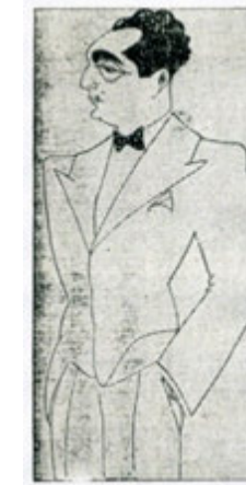
Fernando de la Escosura. Caricatura de Mesa. La provincia , 29 de julio de 1934, p. 3.

Delegación Sindical Provincial 10 . Su presencia en la prensa local fue muy habitual 11 , llegando a contar entre junio y julio de 1936 con una sección en La provincia bajo el título «Arquitectura-Decoración».