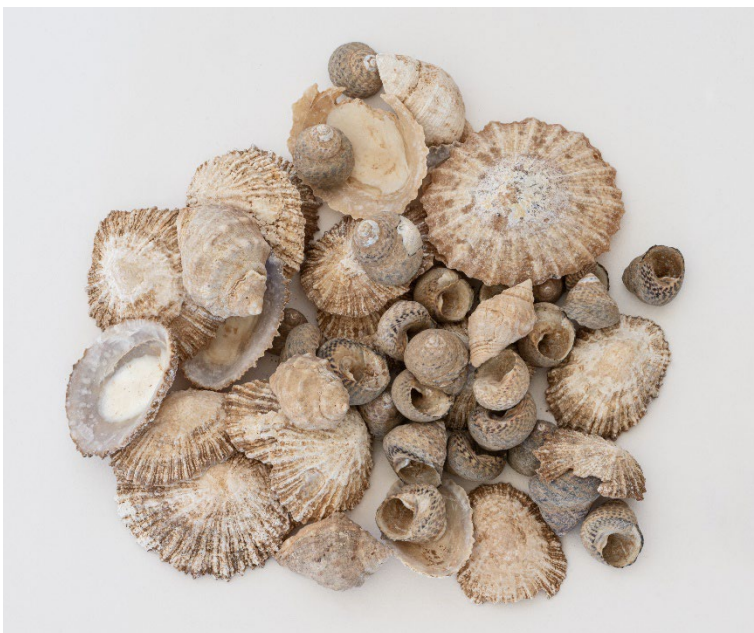
Malacofauna. La Guancha.