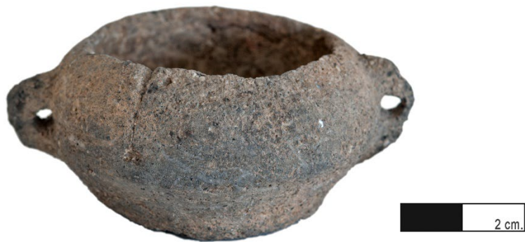
Recipiente de barro cocido. La Guancha.