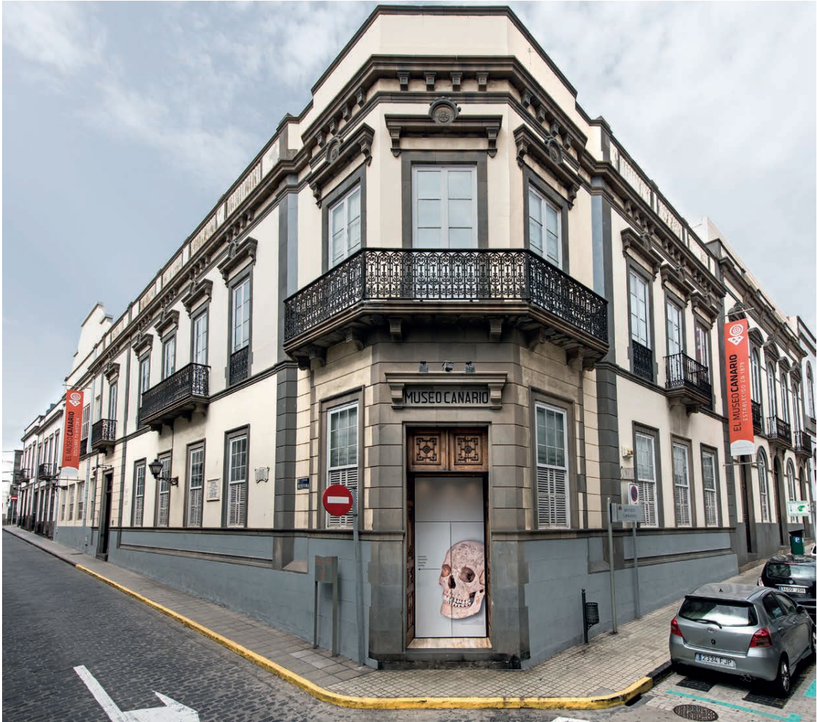
Fachada de El Museo Canario.