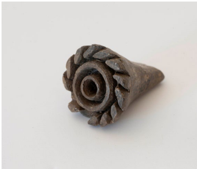
Pintadera. Las Guayarminas.

En este recorrido, una última unidad está dedicada a Las Guayarminas, testimonio del final del mundo indígena y el inicio de una nueva etapa.