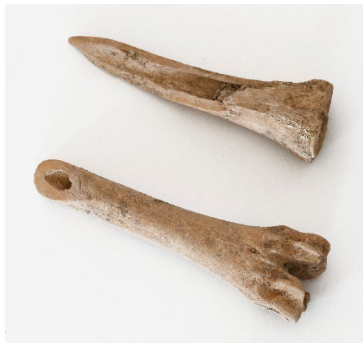
Punzón realizado sobre metacarpo de ovicáprido.

A continuación, las intervenciones arqueológicas desarrolladas en Barrio del Hospital y Playa Chica se abordan mediante una muestra de diferentes materiales recuperados, tratando de acercar al visitante el nuevo conocimiento histórico que sobre la sociedad indígena están aportando tales enclaves.