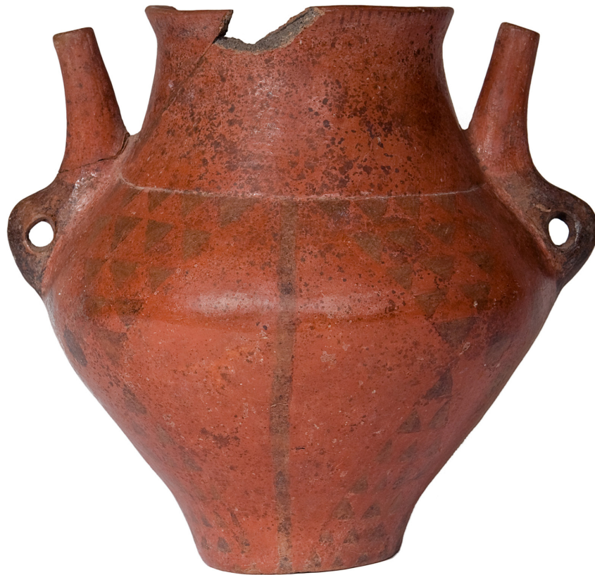
Recipiente cerámico hallado en el túmulo de El Agujero, en Gáldar.

La cerámica es una de las manifestaciones artesanales e industriales más características del ser humano. Su elaboración conlleva procedimientos técnicos complejos que para el caso de la artesanal, la que nos ocupa, implica la existencia de personas especializadas en este tipo de manufacturas.